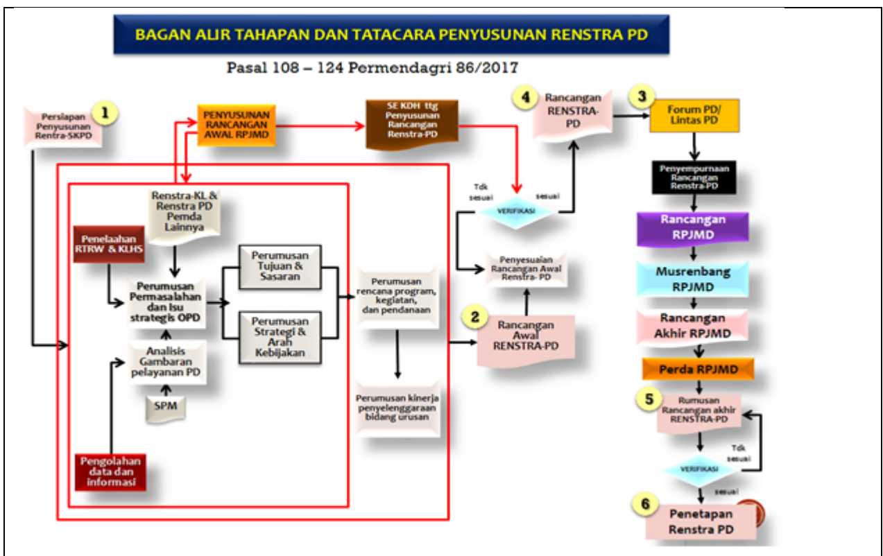
Gambar 1. 1 Proses Penyusunan Renstra Perangkat Daerah